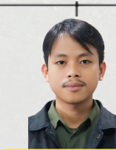
MUHAMMAD YUNUS, ST